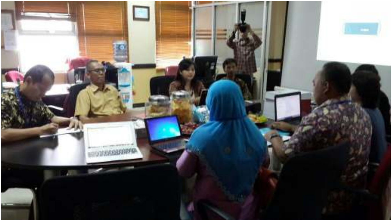
Gambar 1 Proses Audit Mutu Internal