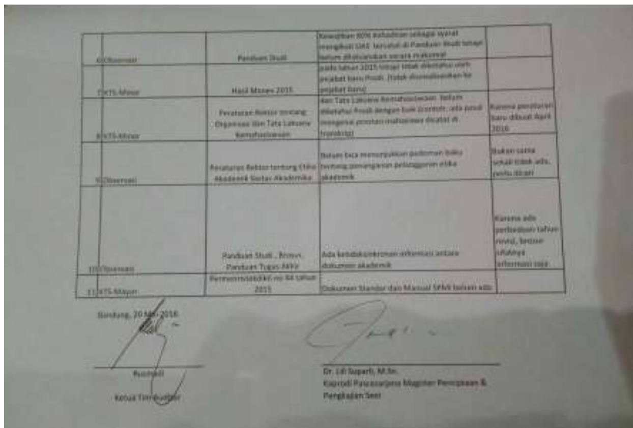
Gambar 2: Hasil Temuan Audit ditandatangani Ketua Tim Auditor dan Teraudit