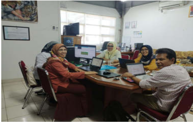
Foto Kegiatan Audit