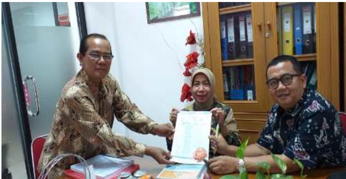
Gambar 1 Proses Audit Mutu Internal