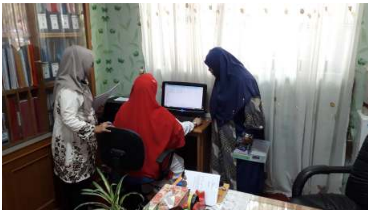
Gambar 1 Proses Audit Mutu Internal